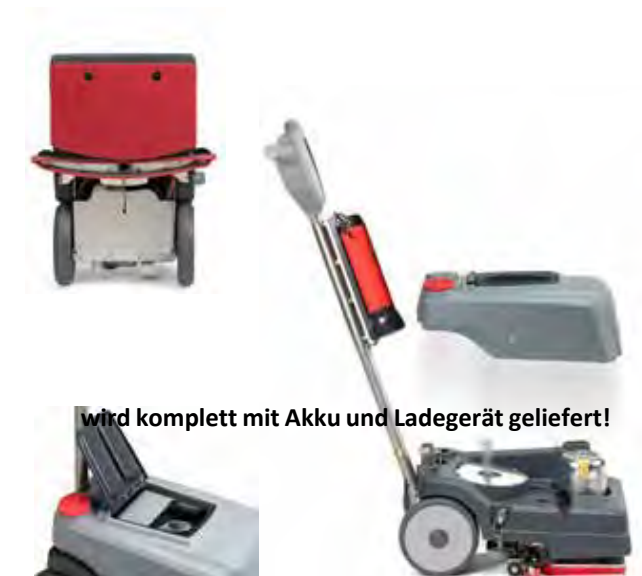
wird komplett mit Akku und Ladegerät geliefert!